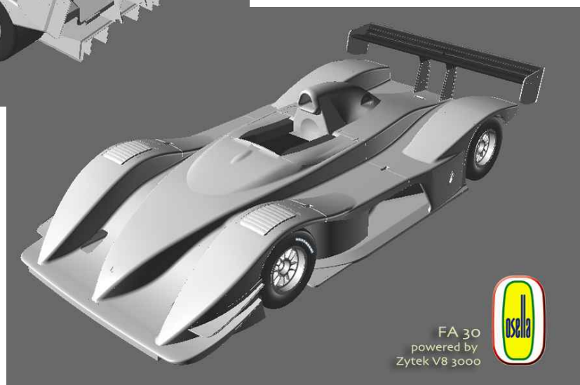
FA 30 powered by Zytek V8 3000

In questi primi disegni si può notare la posizione di guida centrale così come l'airscope che dovrà alimentare il vigoroso motore Zytek V8.